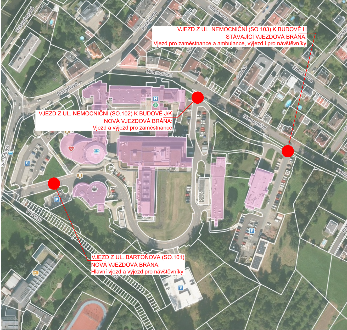
DOLNÍ AREÁL OBLASTNÍ NEMOCNICE NÁCHOD a.s.